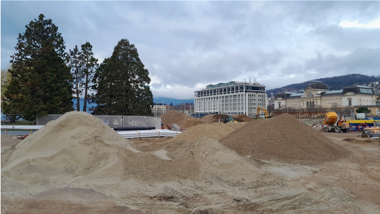
Photo 3 : Installation de chantier sur la place du Douze-Septembre

Cette place de jeux inclusive et sécurisée sera disponible pour le début de la saison estivale 2025. Non loin du restaurant et de l'accès principal du parc, elle proposera un espace original basé sur la fantaisie, dans un environnement de bois rappelant les structures palafittiques et permettant de bouger, creuser, grimper, construire, expérimenter et s'amuser. Des aménagements pour les aînés seront aussi réalisés.