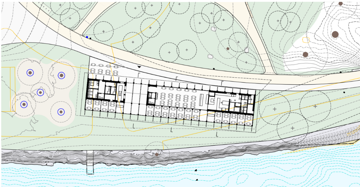
Figure 2 : Plan du futur restaurant du parc des Jeunes-Rives.

Le choix de l'exploitant du restaurant sera déterminé par le Conseil communal sur la base d'un appel d'offres piloté par le Service de la gérance et du logement.