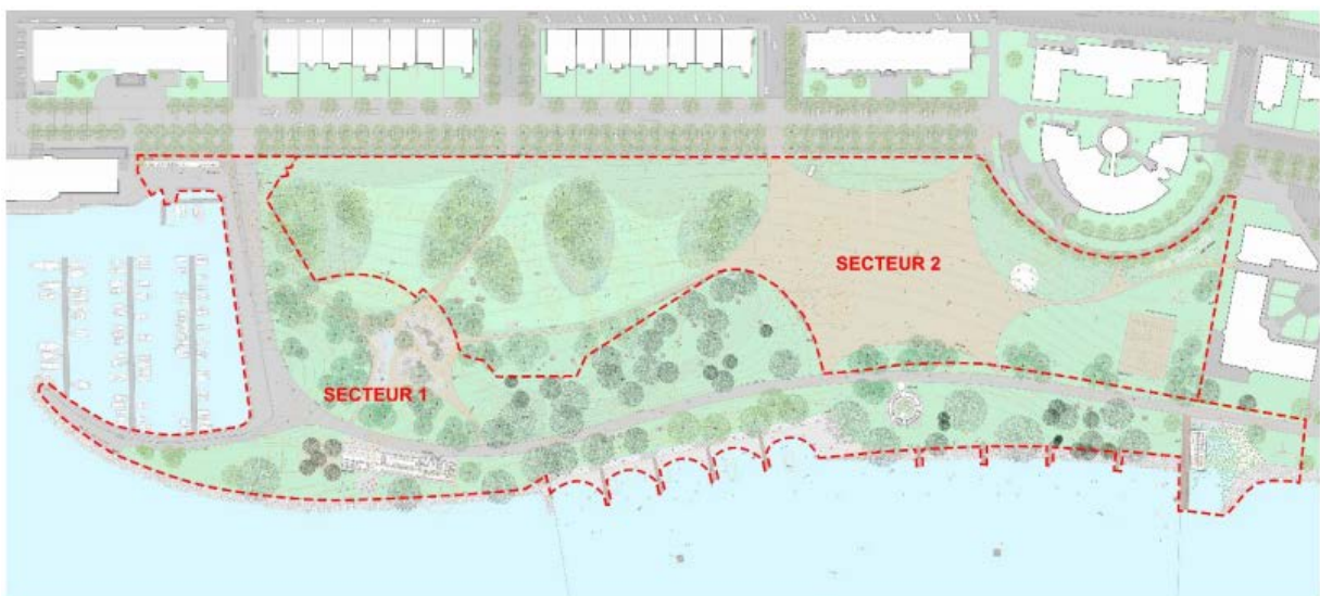
Figure 1 : Secteur 1 « la liaison à l'eau » et secteur 2 « la liaison à la vie en ville »

Les débats tenus par le Conseil général de la Ville de Neuchâtel sur le rapport 20-010 en date du 29 juin 2020 ont confirmé que ce projet était très attendu et une forte majorité des intervenant-e-s a souligné la nécessité de la réalisation de l'ensemble du parc. Ce projet s'inscrit par ailleurs dans la politique globale de la Ville et dans la tendance actuelle des baignades dans le lac, visant à valoriser les rives et l'accès à l'eau, qui doit se concrétiser dans plusieurs secteurs, dont notamment les Jeunes-Rives, Monruz et Serrières.